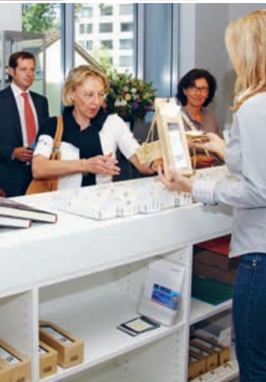
Das «Fest der Sinne» sorgt für Gesprächsstoff. Aktionäre und Kunden diskutieren eifrig nach dem Betriebsrundgang.