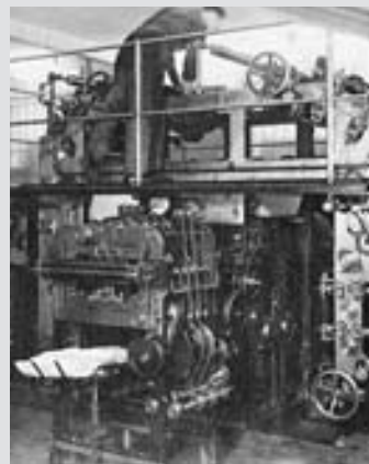
Die «Zürcher Volkszeitung» sowie die «Weltwoche» und die «Annabelle» druckte die Buchdruckerei a/d Sihl auf einer Zeitungsrotation.