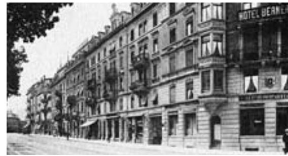
Eckbau an der Kasernenstrasse/Zeughausstrasse in dem sich damals noch das Hotel «Bernerhof» befunden hat. Die Buchdruckerei a/d Sihl erreichte man über den Durchgang an der Kasernenstrasse.