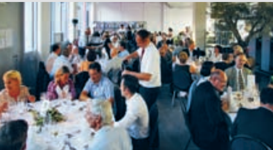
Während dem «Printer's Dinner» genossen die Gäste kulinarische Köstlichkeiten. Die Stimmung unter den Gästen war hörbar gut.