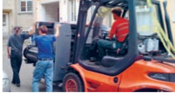
Die schweren Druckmaschinen wurden in einzelne Druckwerke zerlegt auf den Lastwagen verladen.