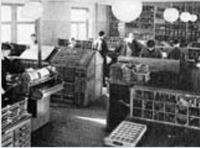
In der Druckvorstufe der Fünfzigerjahre dominierte noch der Handsatz im Blei.