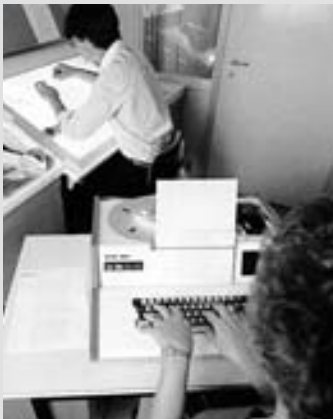
Ende der Siebzigerjahre wurden Druckvorlagen auf einem Leuchtpult in Film montiert und grosse Textmengen auf einem Lochbandperforator erfasst und belichtet.