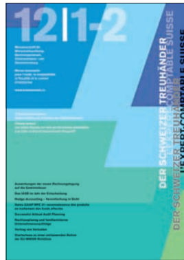
Der Schweizer Treuhänder Auflage 12 000 Ex. 10 x jährlich erscheinend