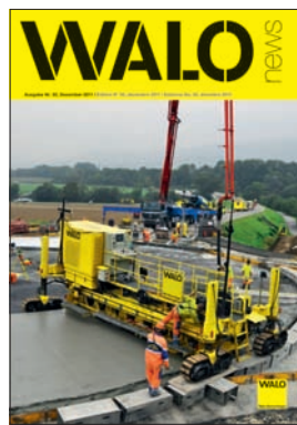
WALO NEWS Auflage 2800 Ex. 3 x jährlich erscheinend