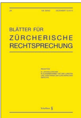
BZR Auflage 1550 Ex. 10 x jährlich erscheinend