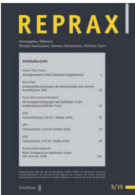
Reprax Auflage 500 Ex. 4 x jährlich erscheinend