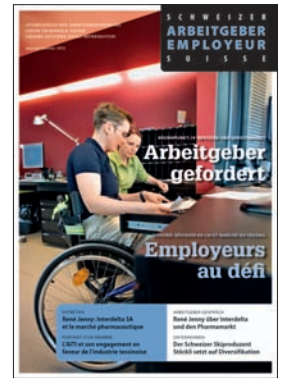
Schweizer Arbeitgeber Auflage 4500 Ex. 12 x jährlich erscheinend