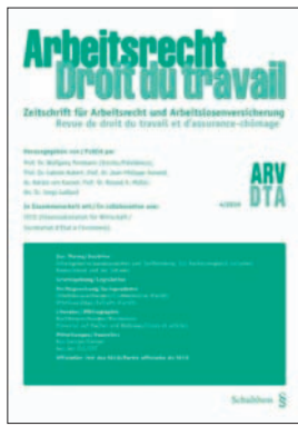
Arbeitsrecht Droit du travail Auflage 1100 Ex. 4 x jährlich erscheinend