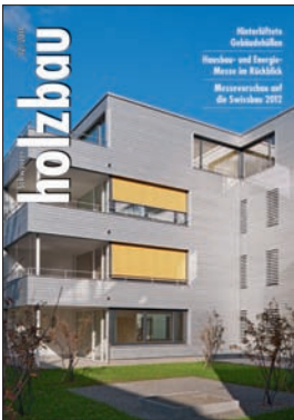
Schweizer Holzbau Auflage 5000 Ex. 12 x jährlich erscheinend