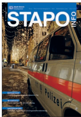
STAPO INFO Auflage 2900 Ex. 10 x jährlich erscheinend