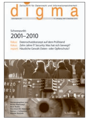
digma Auflage 650 Ex. 4 x jährlich erscheinend