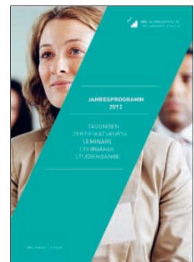
Kursprogramm STS Schweizerische Treuhänder Schule