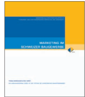
Marketing im Schweizer Baugewerbe Ausbildungszentrum Schweizerischer Baumeisterverband