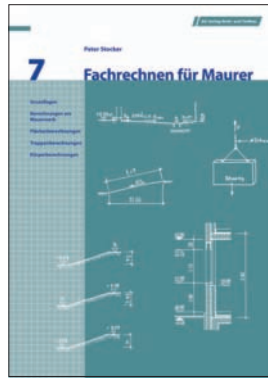
Fachrechnen für Maurer AG Verlag Hoch- und Tiefbau