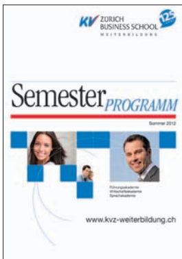
Semesterprogramm KV Zürich Business School