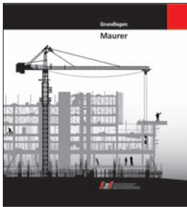
Grundlagen Maurer Schweizerischer Baumeisterverband