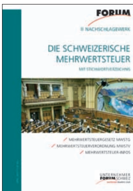
Nachschlagewerk Unternehmer Forum Schweiz