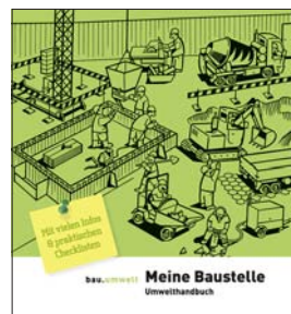
Handbuch Ausbildungszentrum Schweizerischer Baumeisterverband