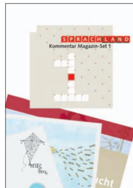
Sprachland Kommentar Magazin-Set 1 Lehrmittelverlag Zürich