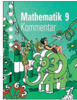
Mathematik 9 Kommentar Lehrmittelverlag Zürich