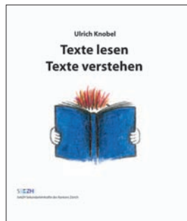
Texte lesen, Texte verstehen SekZH