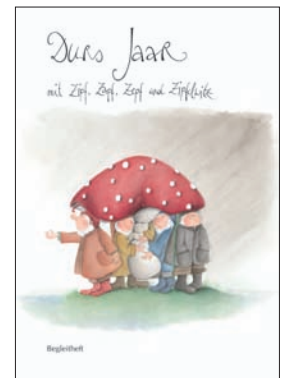
Durs Jaar mit Zipf, Zapf, Zepf und Zipfelwitz Lehrmittelverlag Zürich