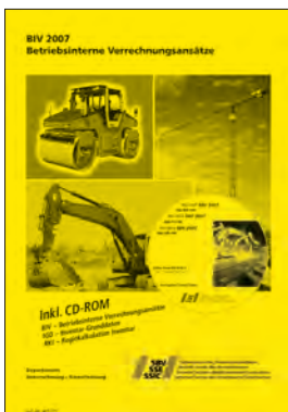
SBV Betriebsinterne Verrechnungsansätze