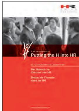
HR Swiss Congress Einladungskarte