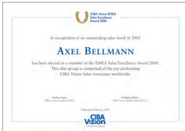
CIBA Vision Zertifikat