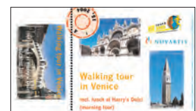
Novartis ISE-Award, Souvenir-Ticket