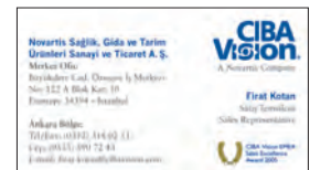
CIBA Vision Visitenkarte