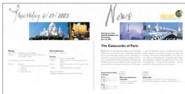
Novartis ISE-Award, Newsletter